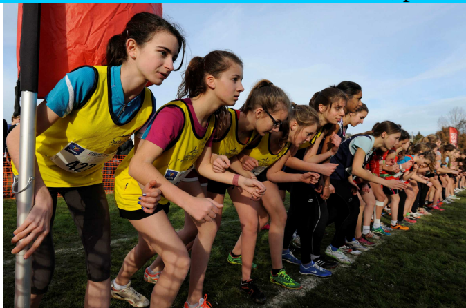
Départ des cadettes filles