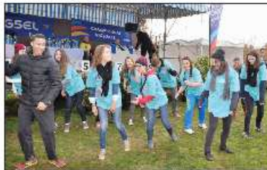
Aux quatre coins du site, (ici devant le podium), les danseurs-bénévoles ont rythmé la journée, pour le plus grand plaisir du public qui s'est parfois prêté au jeu.