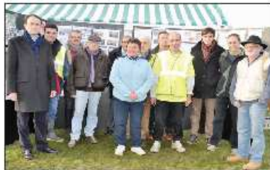
Quelques anciens élèves et sportifs de Saint-Michel se sont retrouvés autour de travail réalisé par les membres de la commission historique.