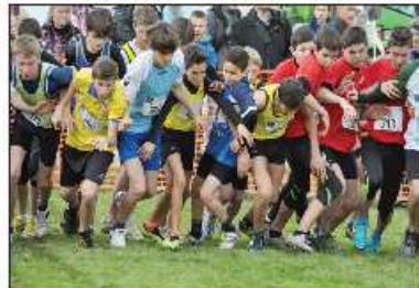
«Joue des coudes !» Sur la ligne de départ (ici, en jaune et noir, les minimes garçons de Saint-Michel), pas question de se faire de cadeau.