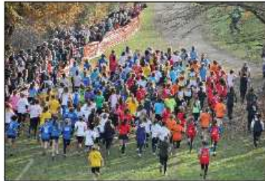
Au départ, la montée a certainement dû en surprendre plus d'un.

Du soleil, un site verdoyant, des bénévoles motivés. Tout était réuni, samedi 14 décembre ! Sur le site de l'Oisillière, les participants, de tous âges et de tous horizons, ont pris plaisir à partager cette journée conviviale et sportive, autour du thème "Osons la rencontre".